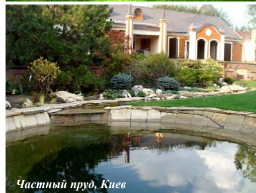
Частный пруд, Киев