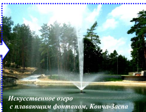
Искусственное озеро с плавающим фонтаном, Конча-Заспа