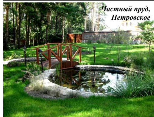
Частный пруд, Петровское